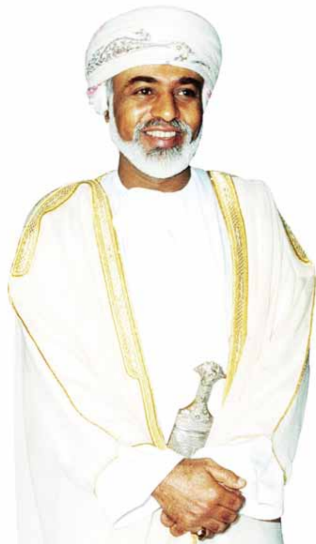
حضرة صاحب الجلالة السلطان قابوس بن سعيد المعظم حفظه الله ورعاه